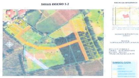
"Imagen #1 – Diseño Sitio Segregación"

Remito al honorable Concejo Municipal para que ratifique los anteriores acuerdos e indique expresamente si se aprobó el proyecto con el siguiente diseño de sitio , el cual consta en la Carta de Intenciones y en la página no. 4 del Convenio, ambos documentos aprobados por ese órgano, siendo que el Convenio fue signado por la Alcaldía Municipal desde el pasado 13 de junio de 2022.